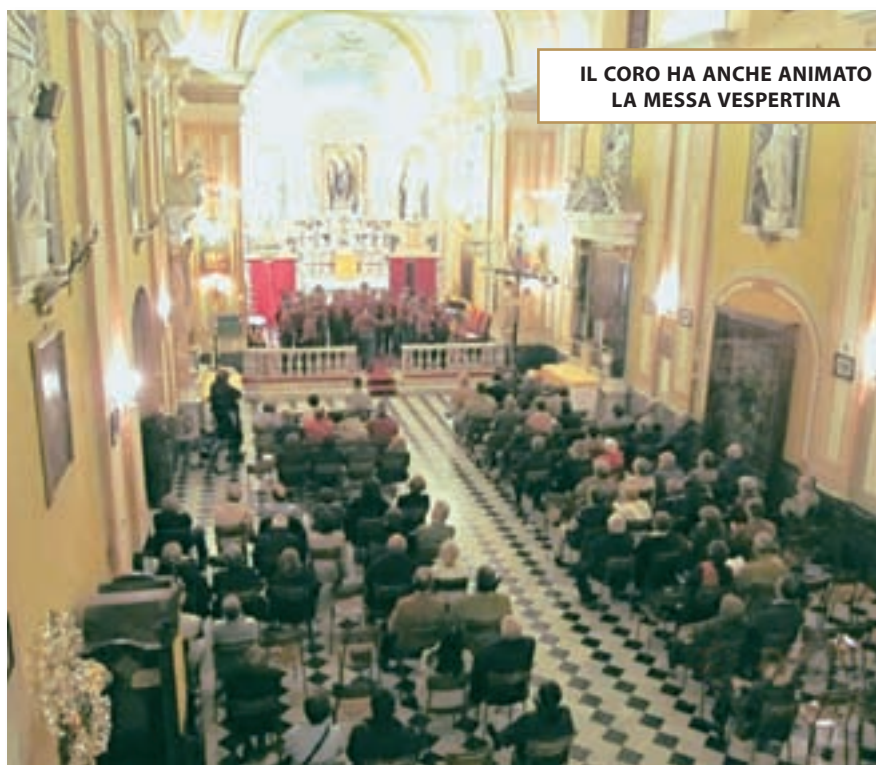
IL CORO HA ANCHE ANIMATO LA MESSA VESPERTINA