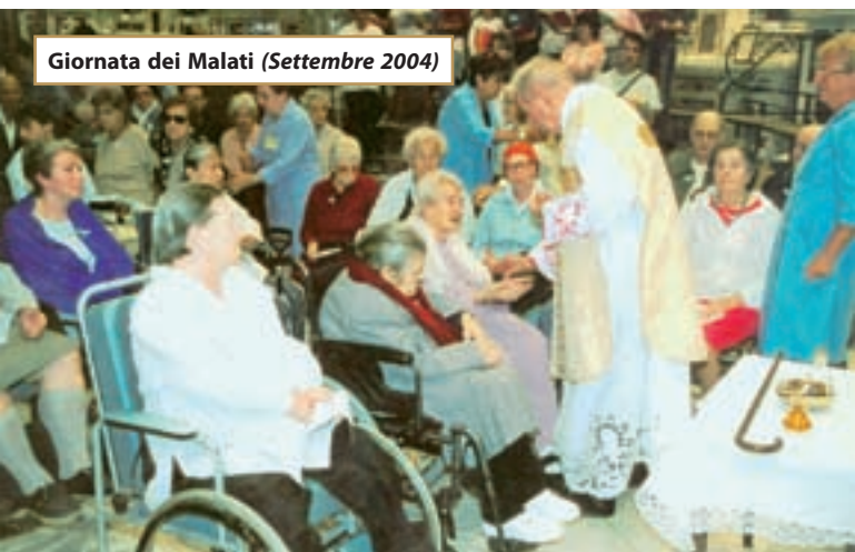
Giornata dei Malati (Settembre 2004)