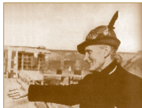
Don Carlo Gnocchi, l'indimenticabile padre dei mutilatini (1902-1956), è stato proclamato Beato domenica 25 ottobre, nel corso di una solenne liturgia a Milano, in piazza Duomo.