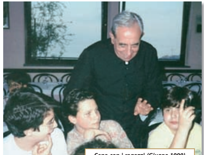
Cena con i ragazzi (Giugno 1990)

Nel partecipare il resoconto della serata del 31 ottobre a chi non ha potuto essere presente, ci piace anche illustrare con le immagini due aspetti della pastorale che gli erano particolarmente cari.