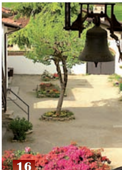
◀ Monastero di Bose: la campana che scandisce la giornata.