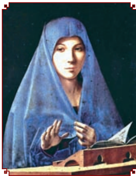
ANNUNCIATA Antonello da Messina, 1429/30 - 1479